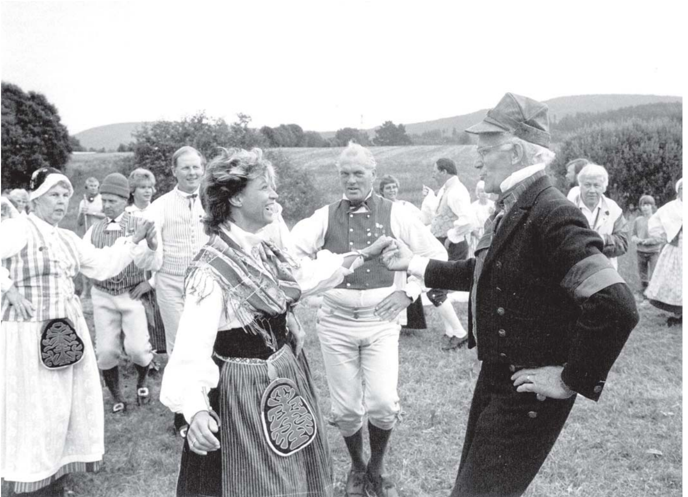
Barbro "Lillbabs" Svensson och "Hambogeneralen" Lars Hansson tar en svängom i Hårga.