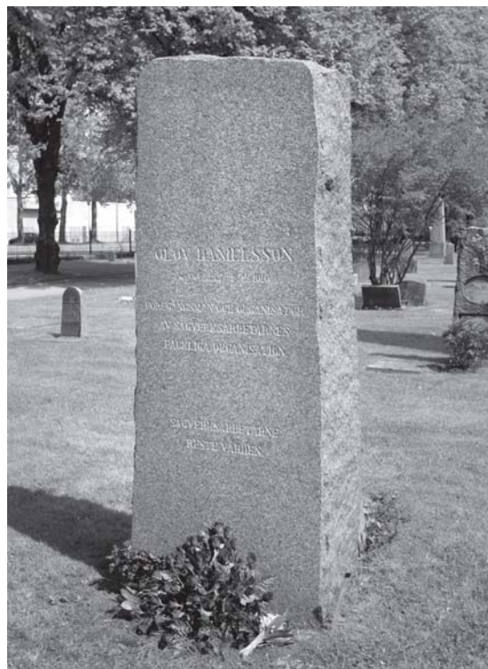
Inskriptionen: Olov Danielsson * 14/1 1855 +9/2 1910 Föregångsman och organisatör av sågverksarbetarnas fackliga organisation, Sägverksarbetarna reste vården.