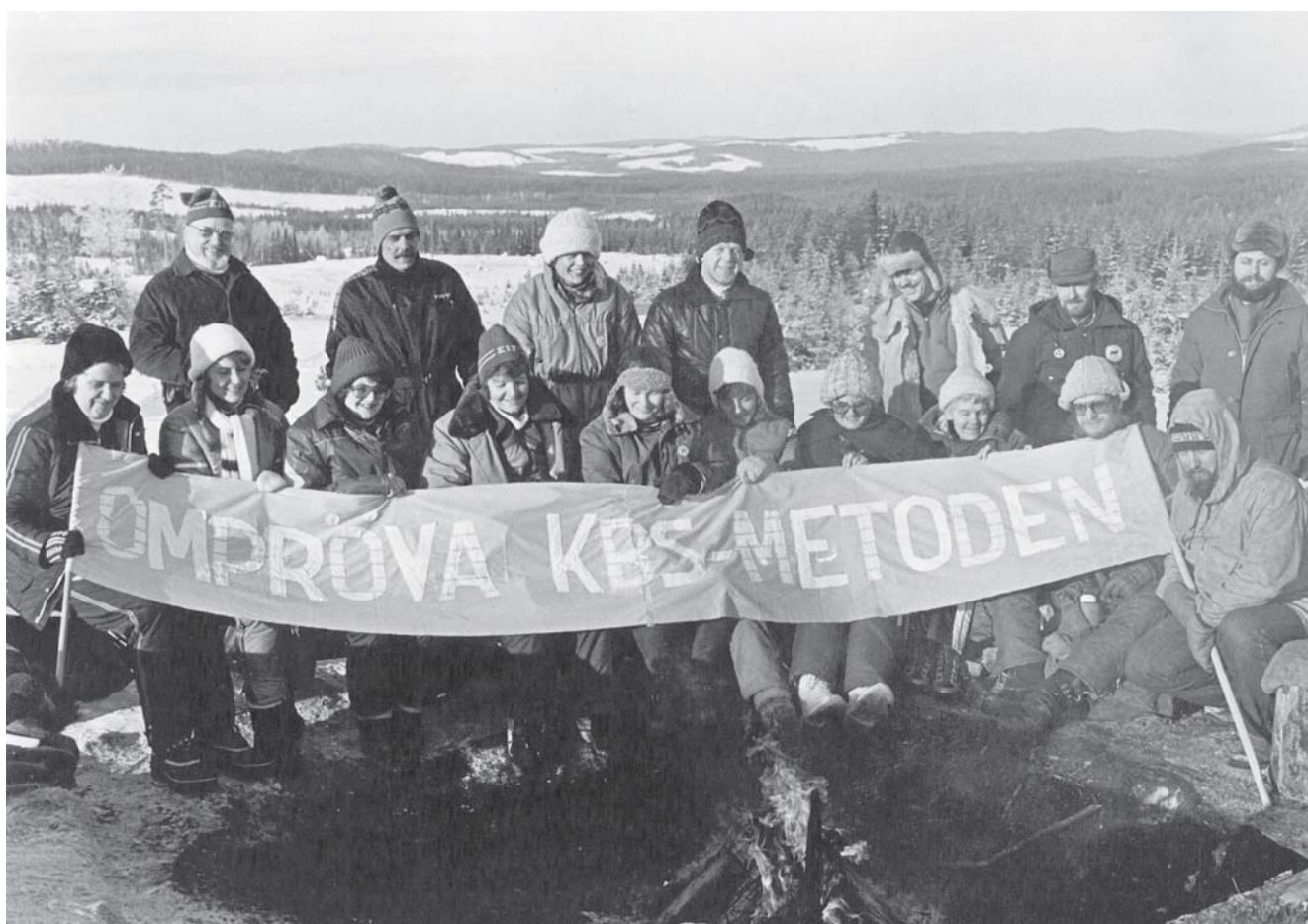
Aktion på Svartboberget. Borrplatsen hölls under ständig bevakning av Rädda Voxnadalen.