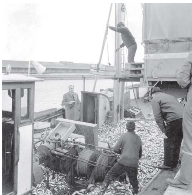
Trålaren "Magne" i Gävle hamn 1972 med årets rekordfångst, nästan 13 ton strömming.

Att materialet nu förvaras på Arkiv Gävleborg är en följd av Sofia Hedéns inventering av föreningslivet i Ljusdals kommun. I Bollnäsinventeringens kölvatten har bland annat Röda korset i Bollnäs respektive Arbrå blivit medlemmar. Båda föreningarna är högst aktiva och även anrika, Bollnäs-föreningen firar 100-årsjubileum i år. Andra exempel på fina och kompletta arkiv som deponerats är Kilafors IF, IOGT-NTO lokalföreningarna i Rengsjö och Flästa samt Bollnäs Filadelfiaförsamling.