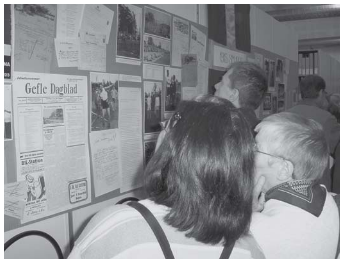
Trängsel framför utställningen om två SM i friidrott, för herrar 1915 och för damer 1928.

Ett stort tack till personalen och styrelsen som ställde upp, utstyrda i sportig klädsel! Vi vill också rikta ett varmt tack till alla som skänkte vinster till vår tipspromenad.